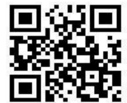
予約システム QRコード

○学校行事・下校の早い日や振替休日がある場合はお早めにお知らせください。 ○右記のQRコードから予約システムに入ってのご予約いただけます。 ○予約システムでご予約をいただくときは 放課後Gr. は「 放デイグループ 」、 個別療育 は「 放デイ 」にご予約ください。